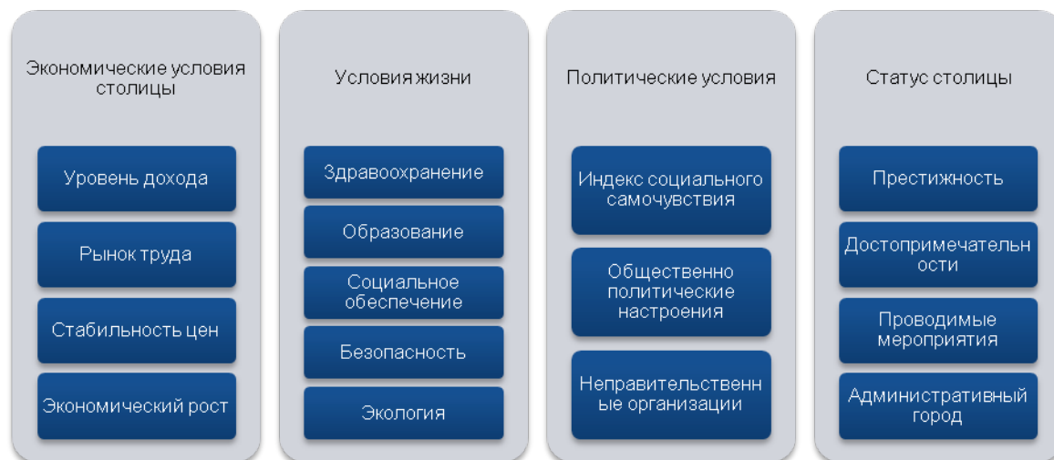
Рисунок 1 – основные факторы привлекательности столицы для мигрантов

На следующем рисунке приведены основные факторы привлекательности столицы.